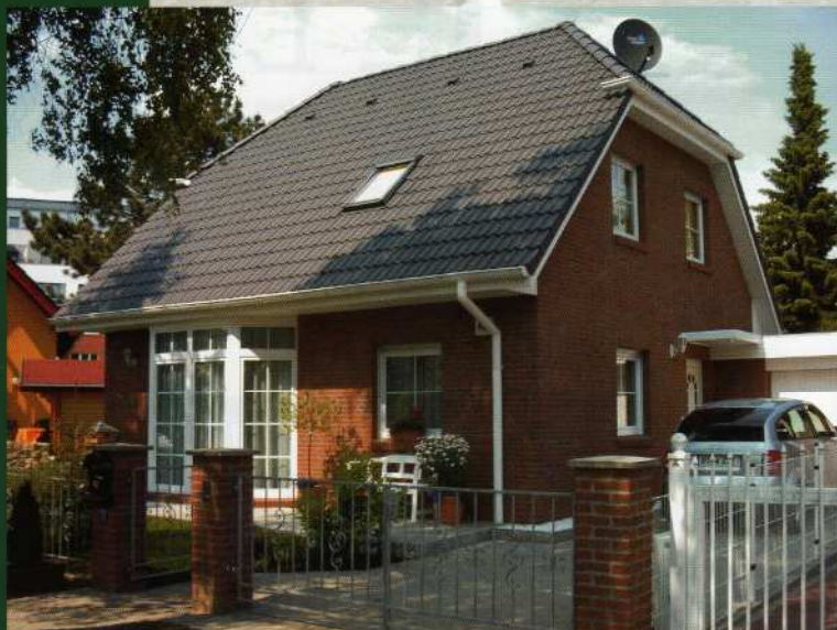
das Bild zeigt eine mögliche Gestaltungsvariante

Grundmaße: 8,50 x 8,24 m zzgl. Erker, Wohn-/Nutzfläche : 109,16 m 2