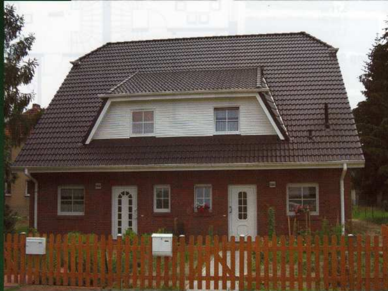
das Bild zeigt eine mögliche Gestaltungsvariante

Grundmaße: 6 x 11 m, Wohn-/Nutzfläche : ca. 100 m 2 je DHH (zuzüglich Ausbaureserve im Spitzboden)