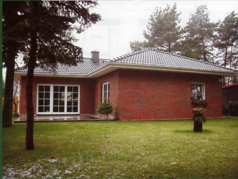
das Bild zeigt eine mögliche Gestaltungsvariante

Grundmaße: 12 x 12 m, Wohn-/Nutzfläche: 97,64 m 2